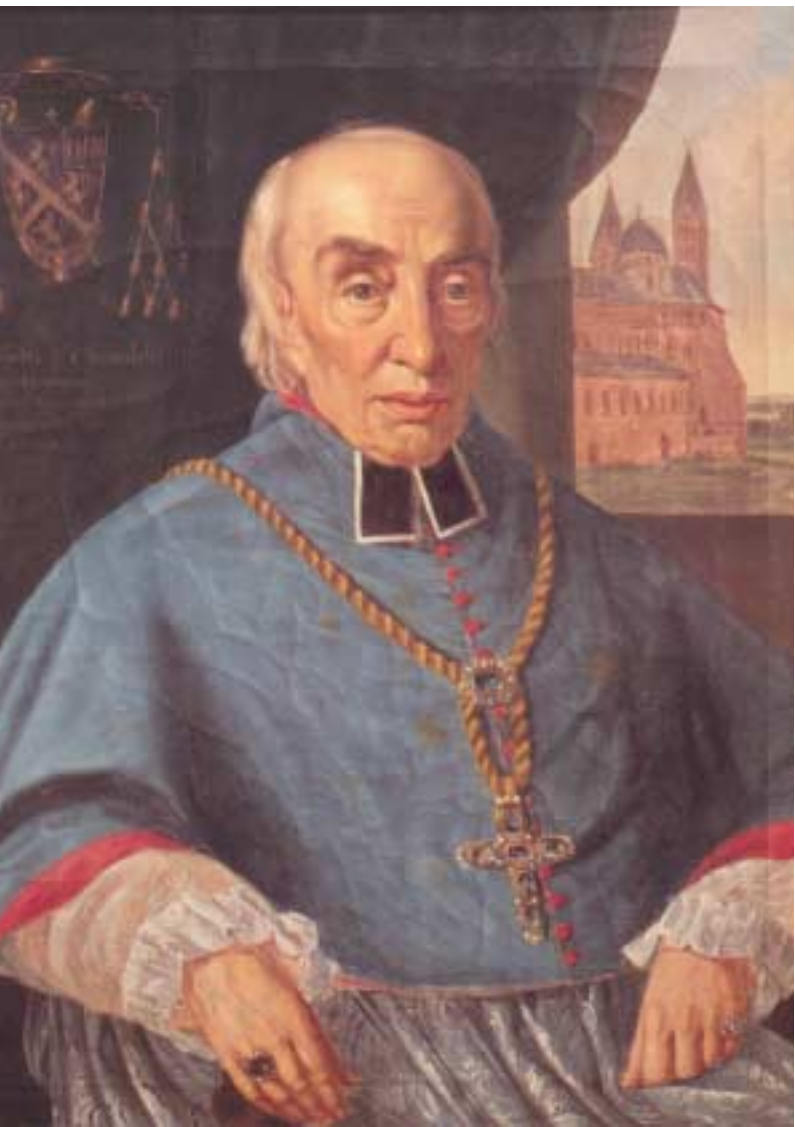
Matthäus Georg von Chandelle war der erste Bischof nach der Neugründung des Bistums Speyers. Er leitete das Bistum von 1818 bis 1826.